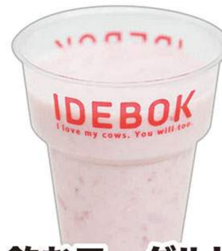
飲むヨーグルト いちご 390円