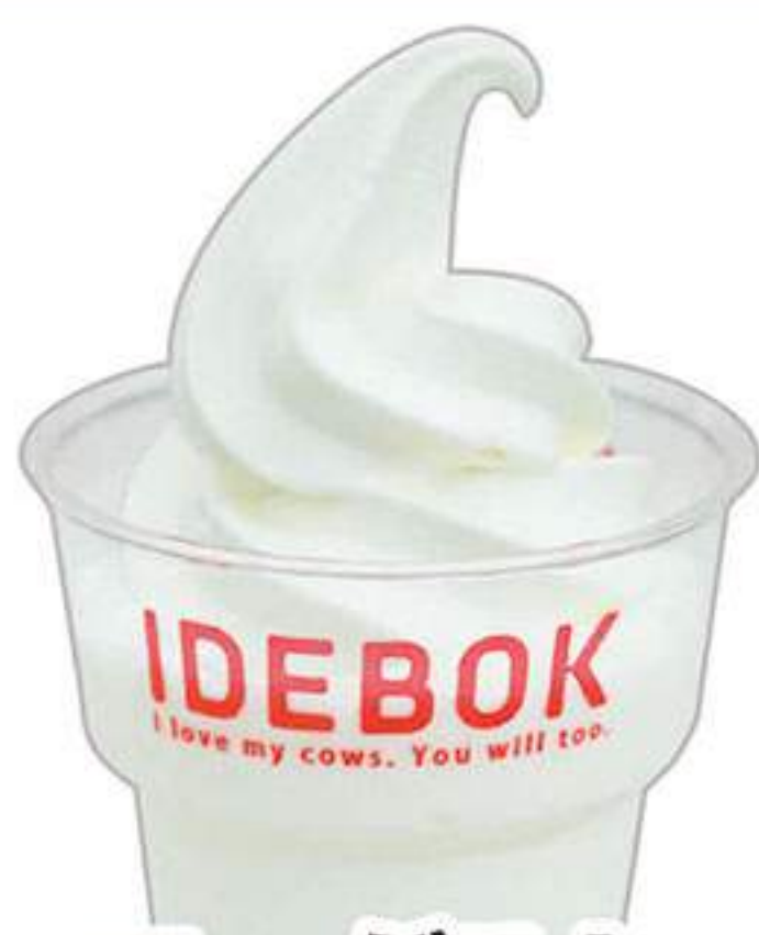
ヨーグルト プレーン ソフトのせ 530円