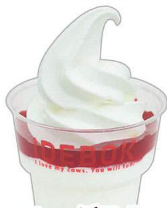
ヨーグルト ストロベリー ソフトのせ 560円