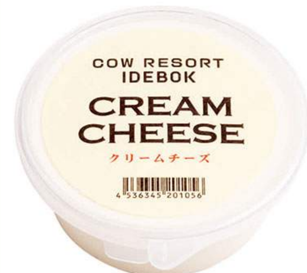
クリームチーズ 980円