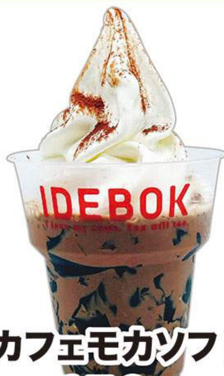
カフェモカソフト 650円