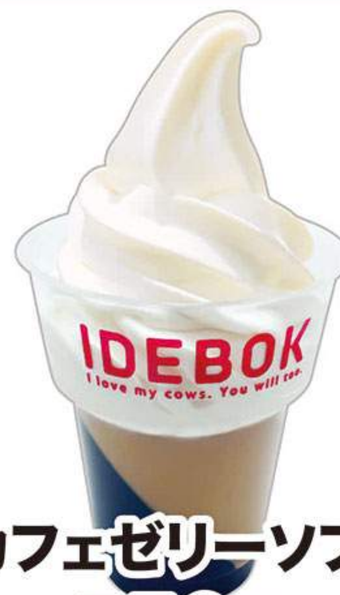
カフェゼリーソフト 550円