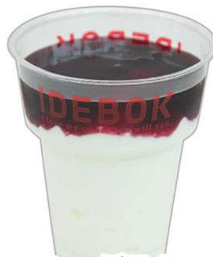
ヨーグルト ブルーベリー 390円