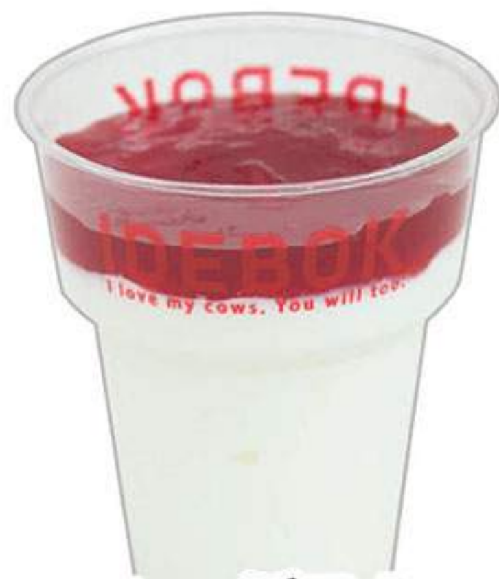
ヨーグルト ストロベリー 390円