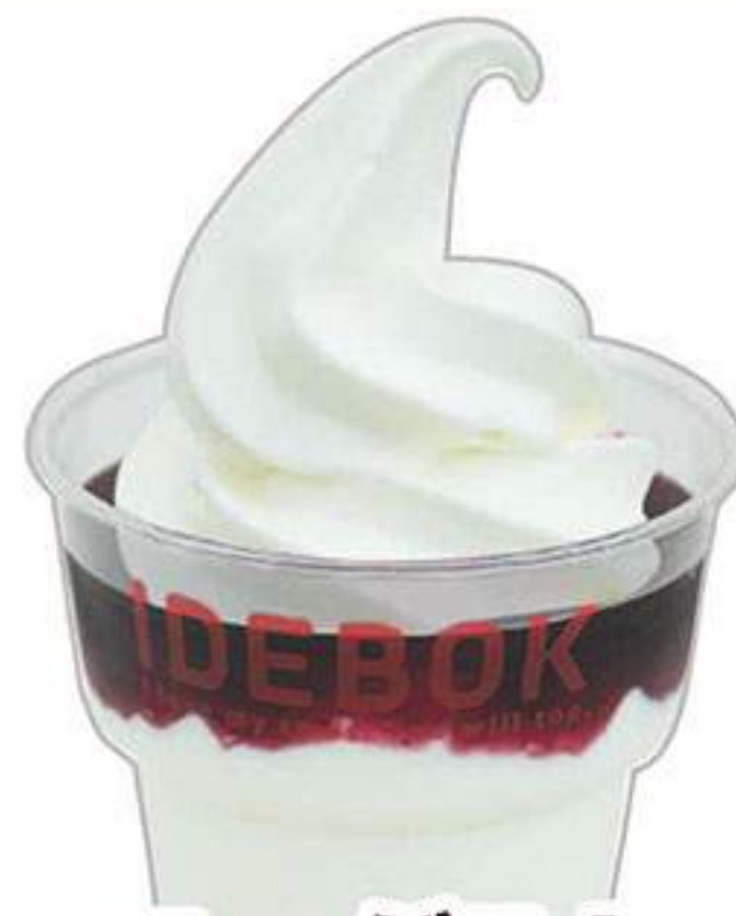
ヨーグルト ブルーベリー ソフトのせ 560円