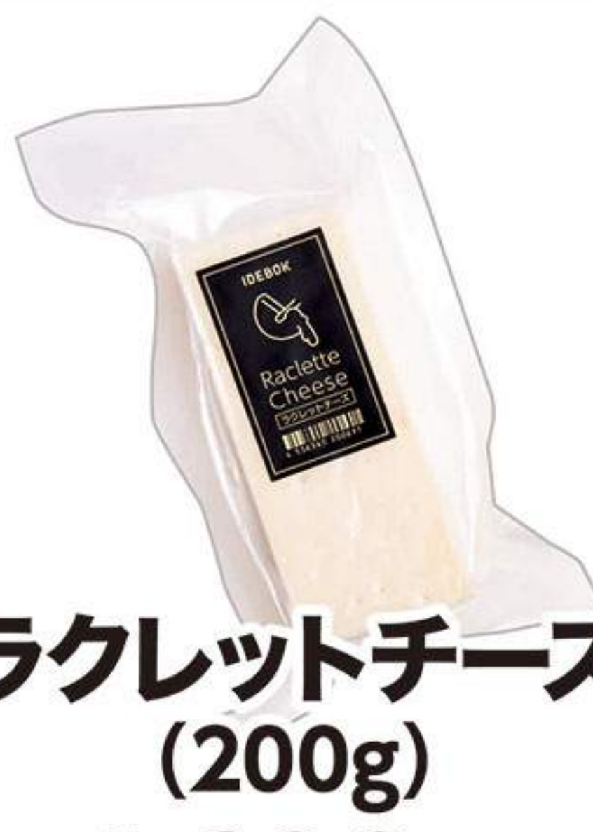
ラクレットチーズ (200g) 1,600円