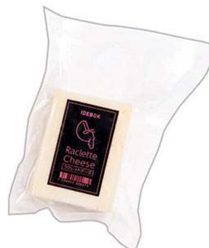
ラクレットチーズ (100g) 860円