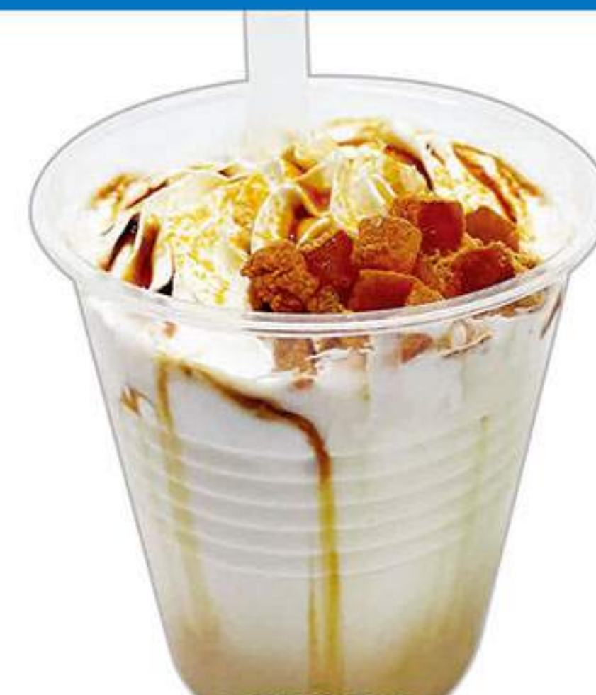
わらび餅ドリンク (きなこ) 580円