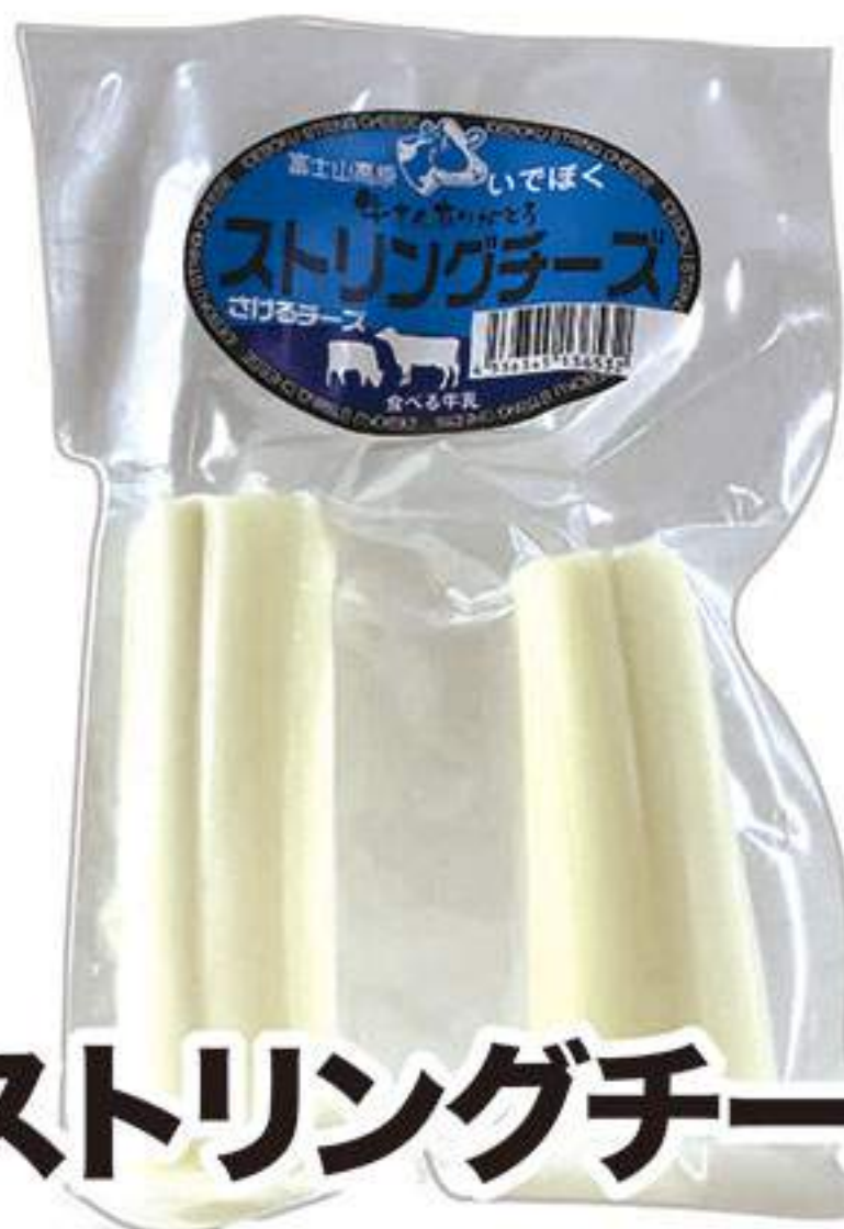
ストリングチーズ 800円