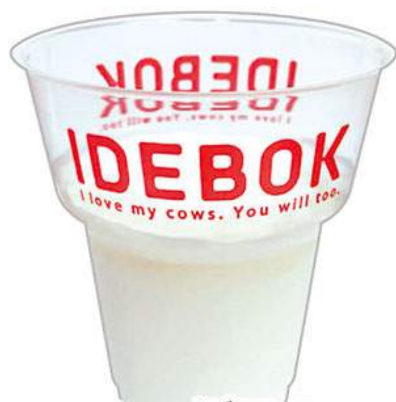
ヨーグルト プレーン 360円