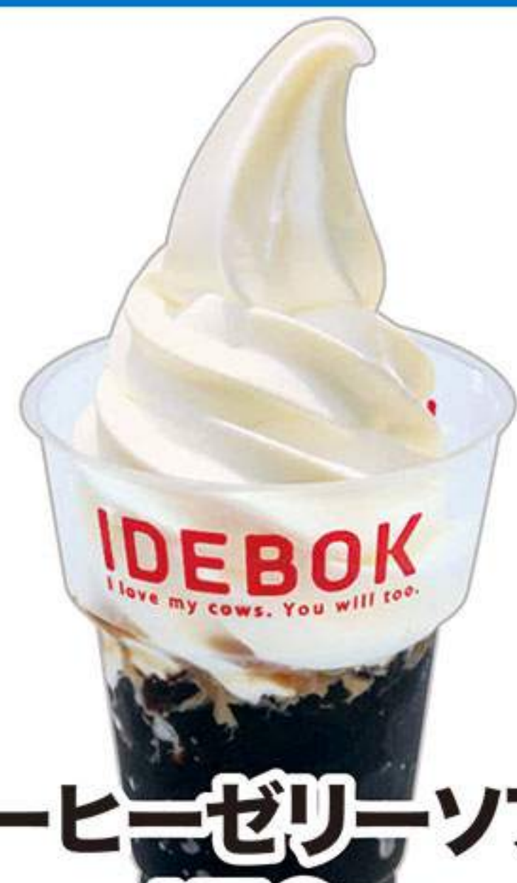
コーヒーゼリーソフト 470円