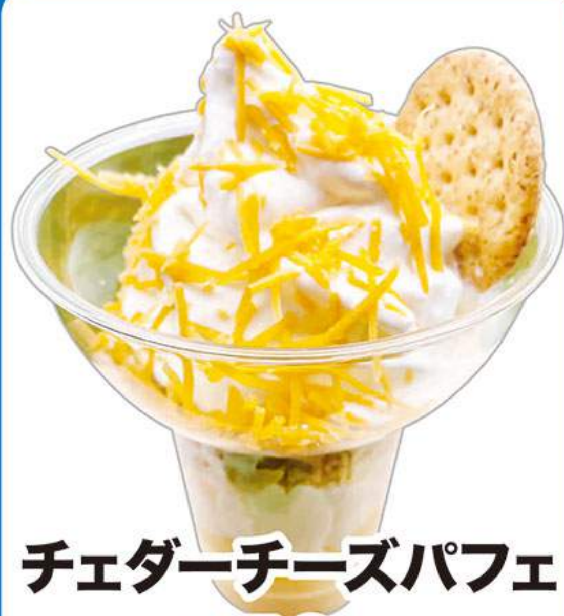
チェダーチーズパフェ 750円