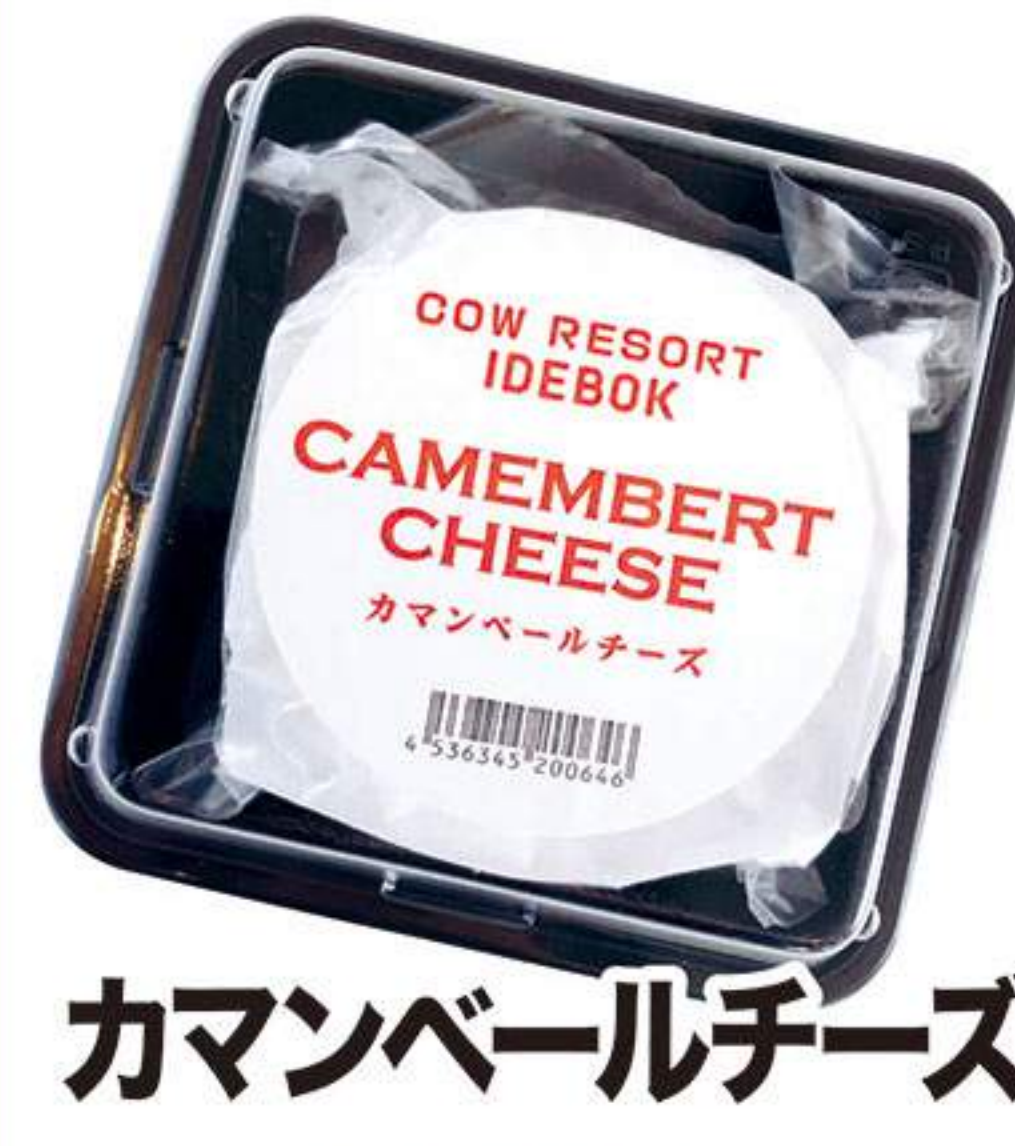
カマンベールチーズ 870円