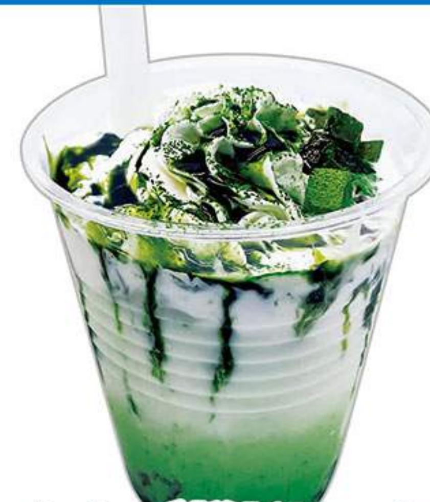
わらび餅ドリンク (抹茶) 580円