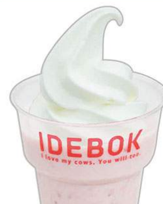
飲むヨーグルト いちご ソフトのせ 560円