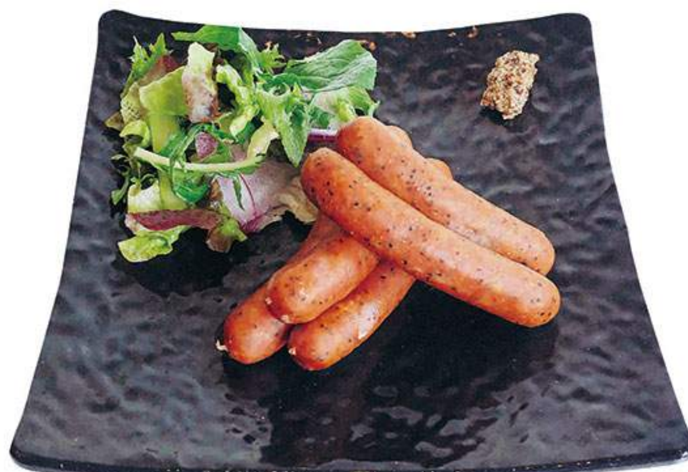
のざ和ウィンナー ブラックペッパー 1,527円(税込1,680円)