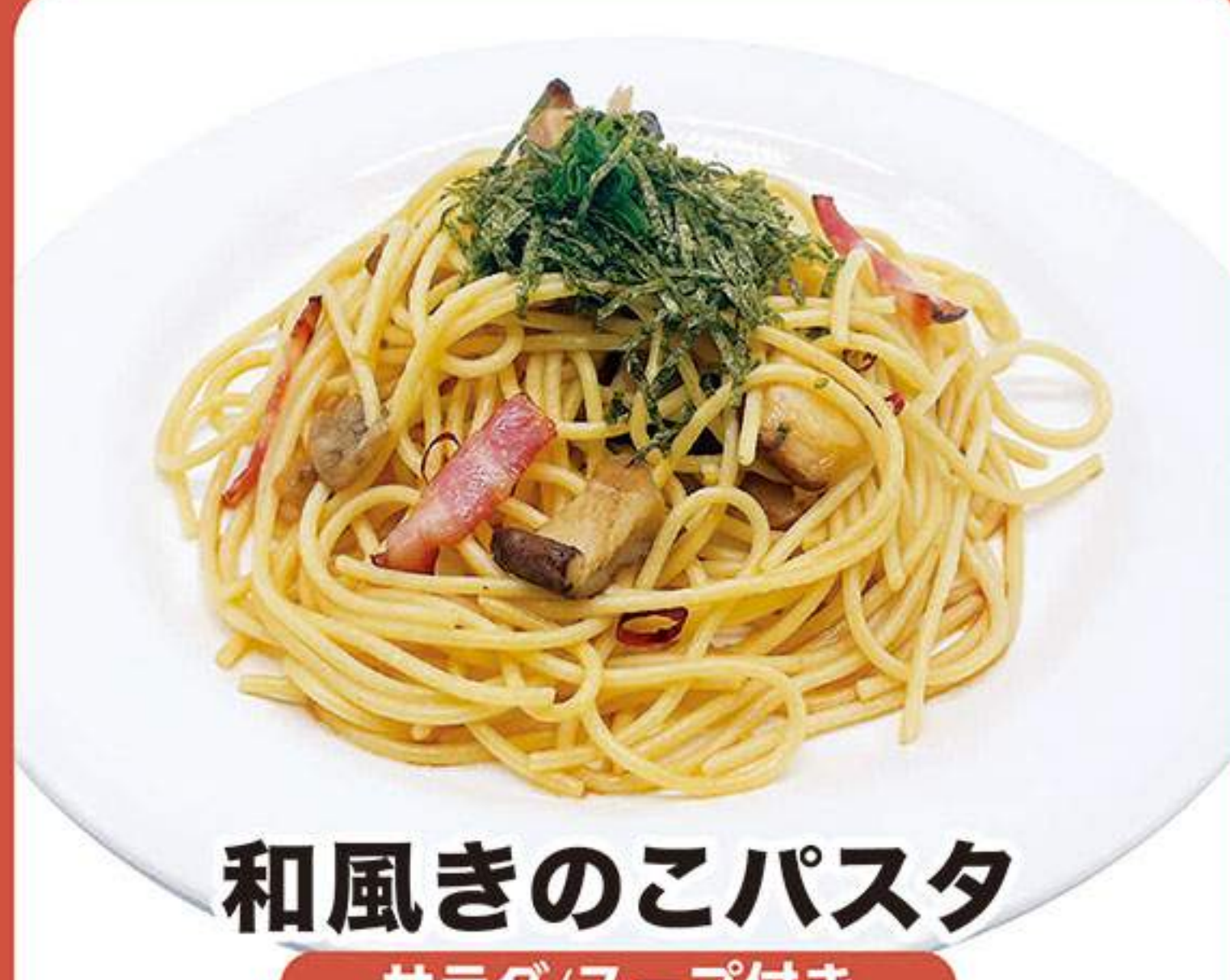
和風きのこパスタ サラダ/スープ付き 1,182円(税込1,300円)