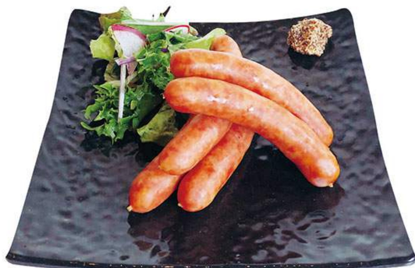
のざ和ウィンナー 粗挽き 1,436円(税込1,580円)