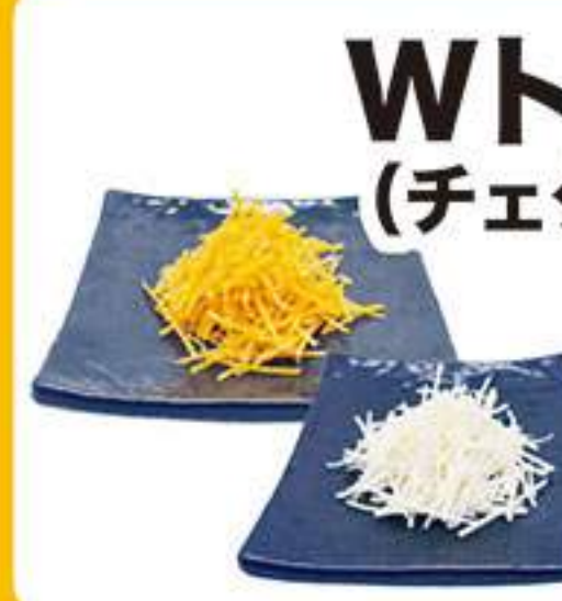
Wトッピング (チェダー&ゴード) 410円 (税込450円)