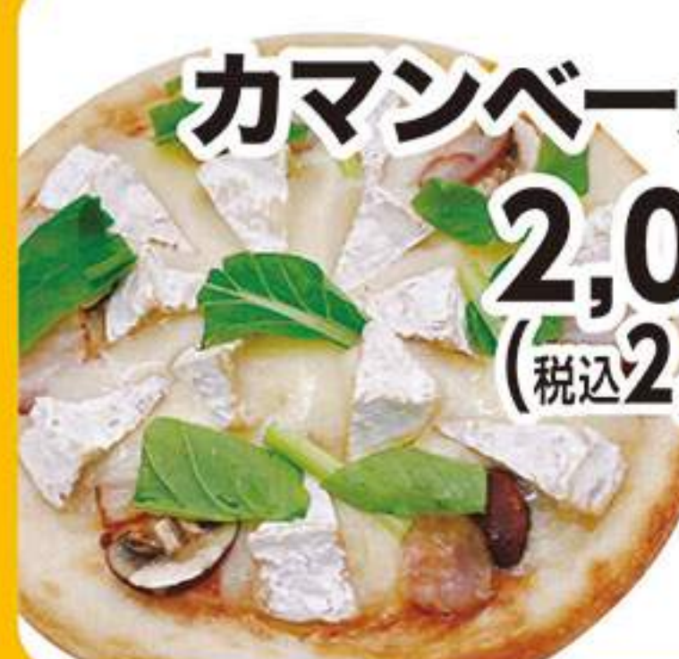
カマンベールピザ 2,091円 (税込2,300円)