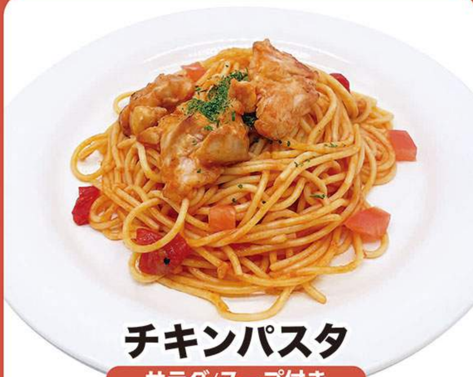
チキンパスタ サラダ/スープ付き 1,182円(税込1,300円)