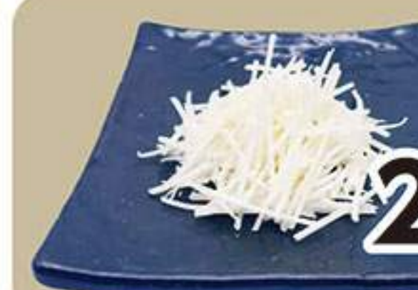
ゴードチーズ 228円 (税込250円)