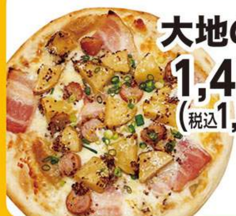
大地のピザ 1,455円 (税込1,600円)