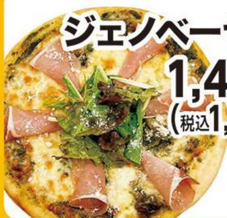
ジェノベーゼピザ 1,455円 (税込1,600円)