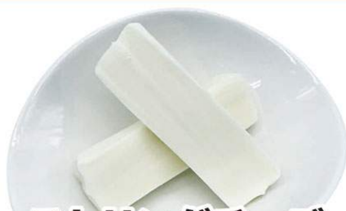
ストリングチーズ 300円 (税込330円)