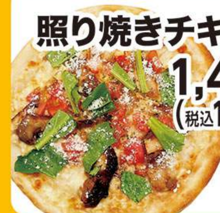
照り焼きチキンピザ 1,455円 (税込1,600円)