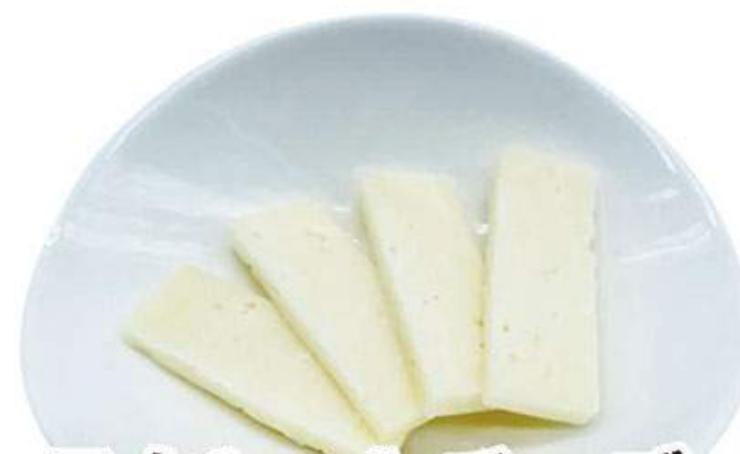
ラクレットチーズ 300円 (税込330円)