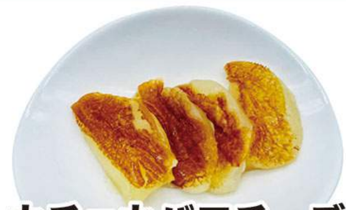
カチョカバロチーズ 300円 (税込330円)