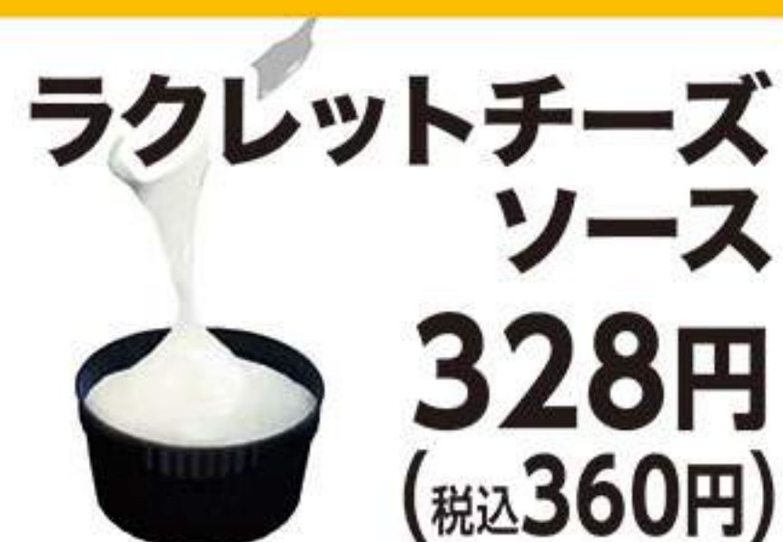
ラクレットチーズ ソース 328円 (税込360円)