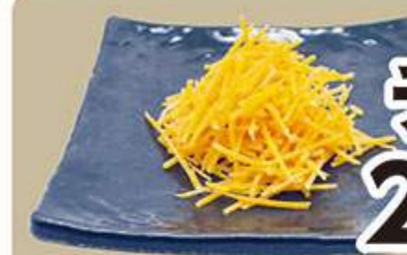
チェダーチーズ 273円 (税込300円)