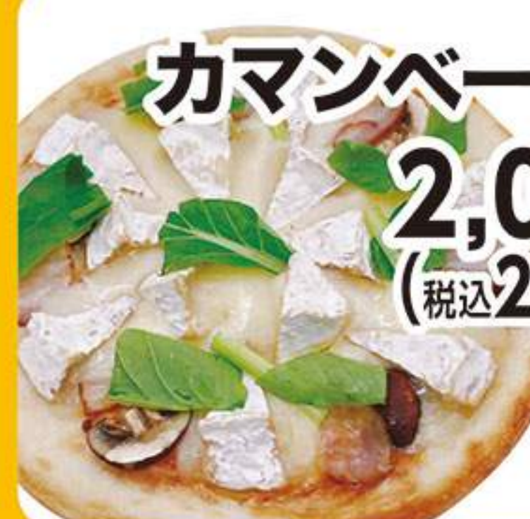
カマンベールピザ 2,091円 (税込2,300円)