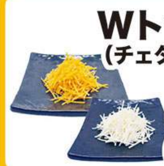
Wトッピング (チェダー&ゴード) 410円 (税込450円)