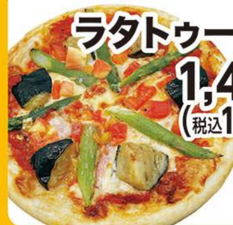
ラタトゥーユピザ 1,455円 (税込1,600円)