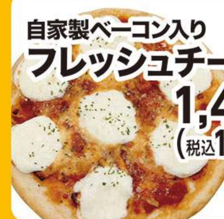
自家製ベーコン入り フレッシュチーズピザ 1,455円 (税込1,600円)