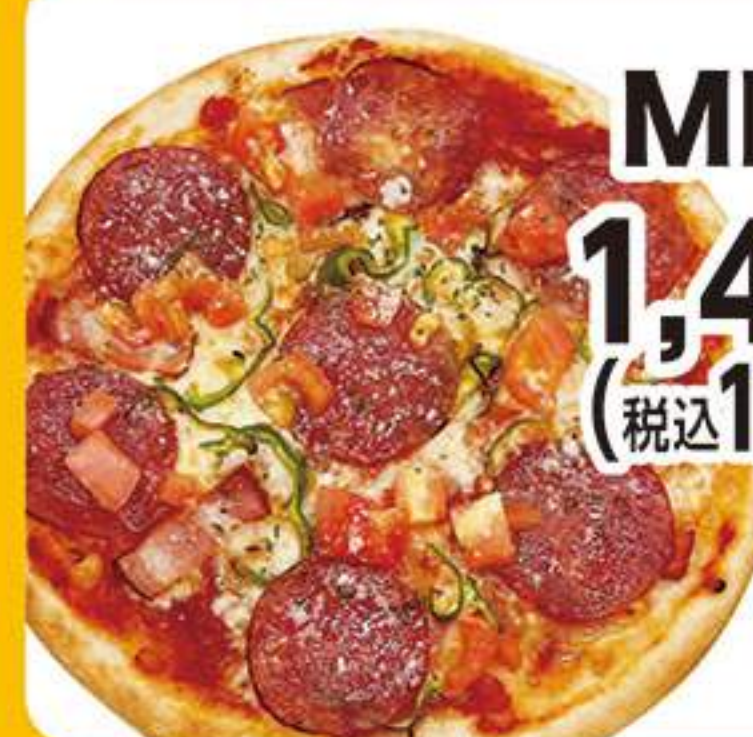
MIXピザ 1,455円 (税込1,600円)