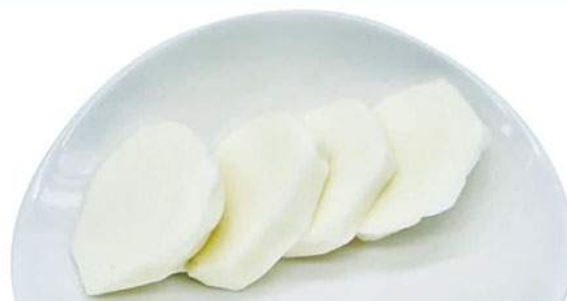
スカモルツァチーズ 300円 (税込330円)