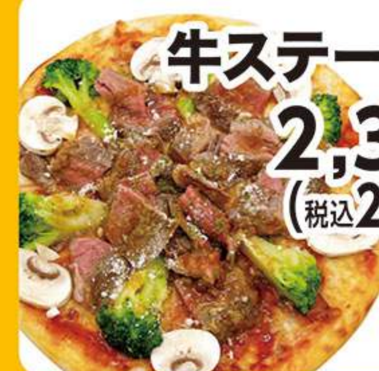
牛ステーキピザ 2,364円 (税込2,600円)