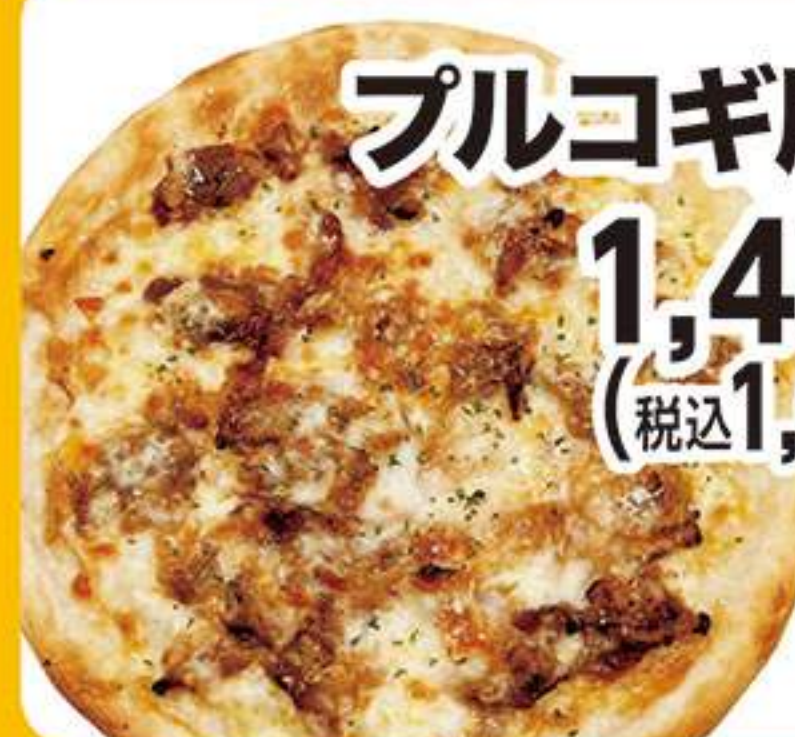
プルコギ風ピザ 1,455円 (税込1,600円)