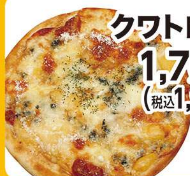
クワトロピザ 1,727円 (税込1,900円)