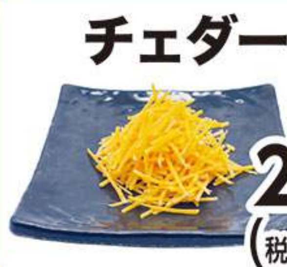
チェダーチーズ 273円 (税込300円)