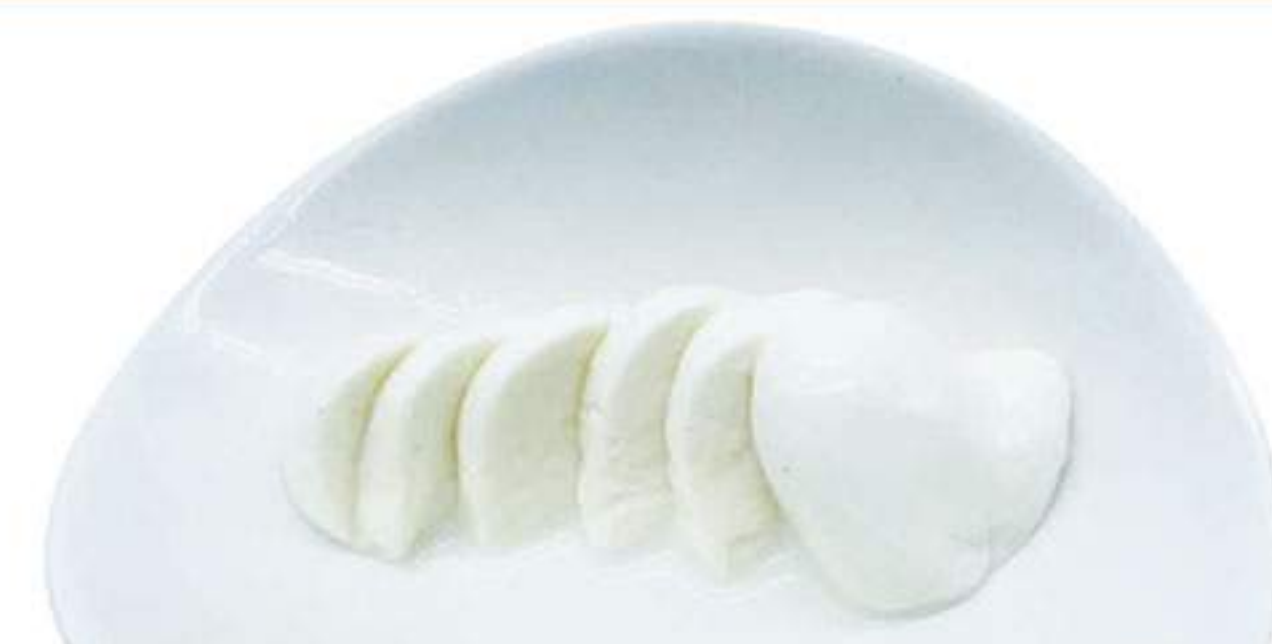
モッツァレラチーズ 300円 (税込330円)