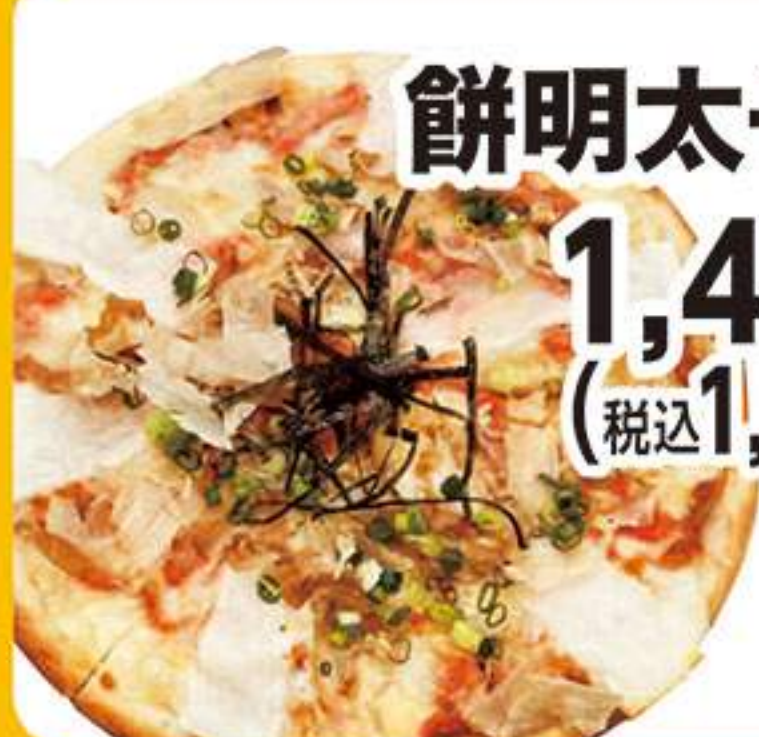
餅明太子ピザ 1,455円 (税込1,600円)