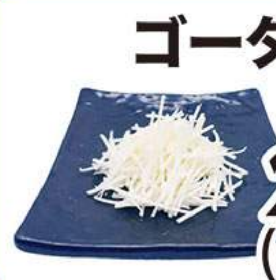
ゴードチーズ 228円 (税込250円)