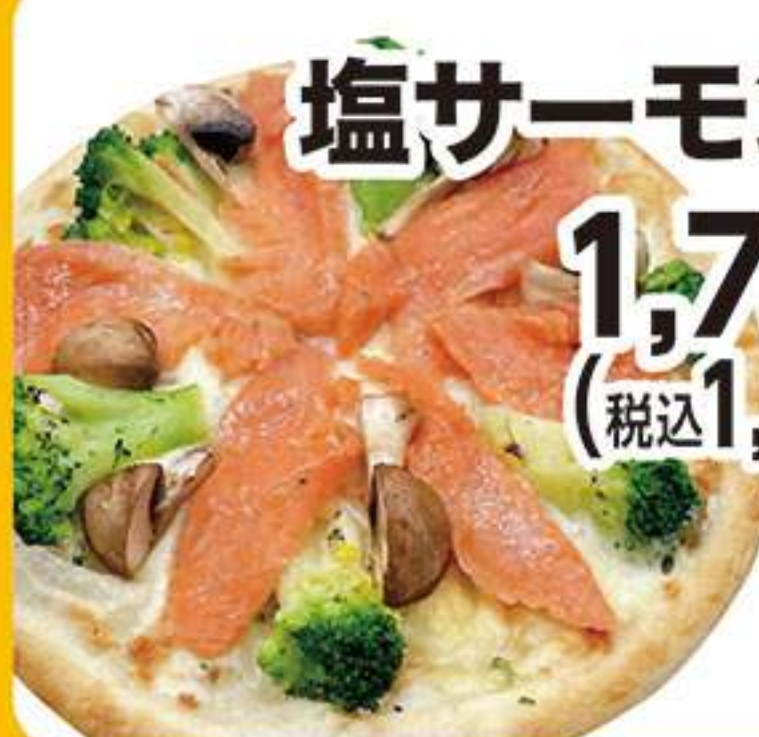
塩サーモンピザ 1,727円 (税込1,900円)