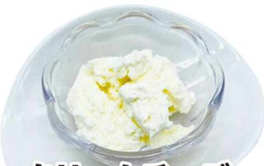
クリームチーズ 300円 (税込330円)