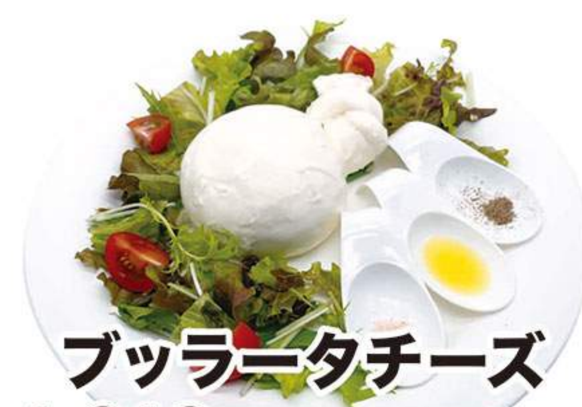
ブッラータチーズ 1,818円 (税込2,000円)