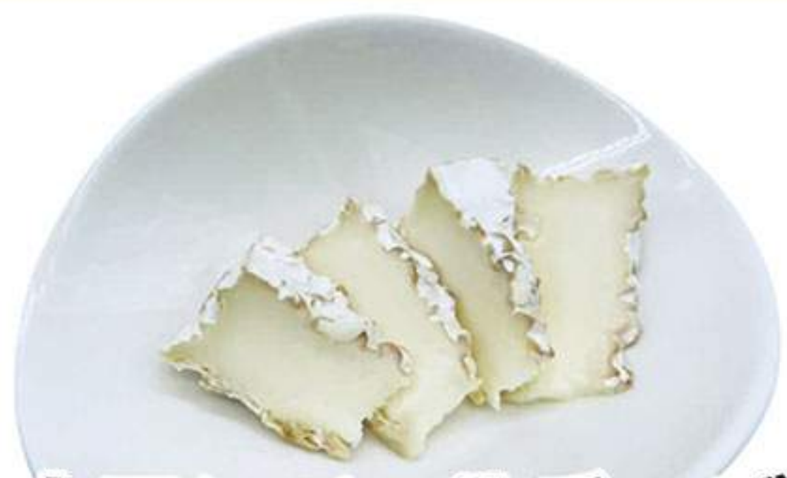
カマンベールチーズ 300円 (税込330円)